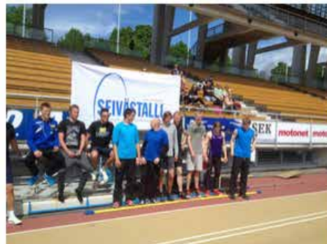
Hyppääjät ennen kisaa yhteiskuvassa.